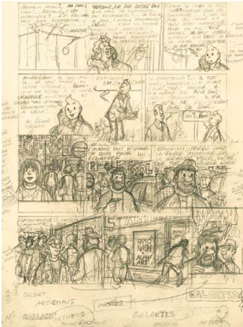
La troisième planche de "l'Alph'Art": "Un album qui laisse la porte ouverte à l'imaginaire." CASTERMAN

BANDE DESSINEE · Casterman réédite «l'Alph'Art», qui était jusque-là réservé aux tintinophiles fortunés. L'occasion, à travers un album seulement esquissé, de voir le génie d'Hergé en plein processus créatif.