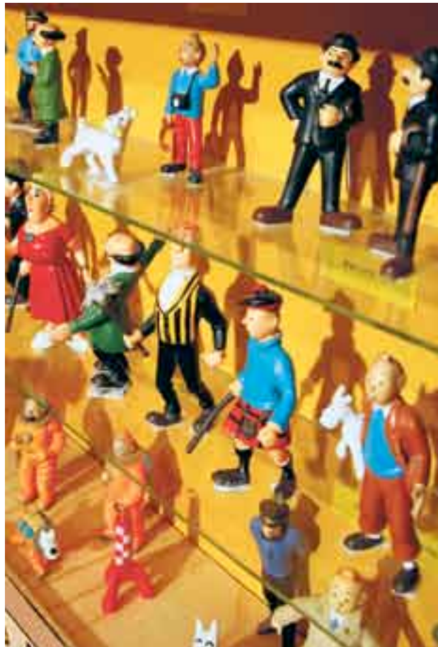
Schulze und Schultze, Nestor, Castafiore, Haddock & Co.