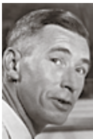
Georges Remi alias Hergé, Tims Schöpfer.