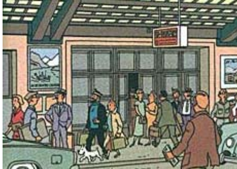
Haddock et Tintin devant la Gare Cornavin (© Hergé/Moulinsart) (TSR)

Les trois-quarts de siècle de Tintin nous offrent l'occasion d'évoquer ses relations avec la Suisse.