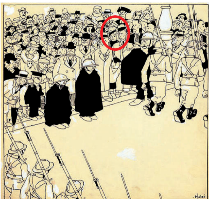
AUTOCARICATURE Quick et Flupke 1933: dans ce gag, Hergé se dessine avec chapeau, aux côtés de sa première épouse et de son frère.